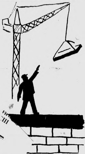
ОЙКЕ. Рис. В. ШТРИХ.

Если лица покрываются морщинами, Значит, мальчики становятся мужчинами, Значит, мальчики уже не дети. Значит, мальчики за все в ответе. Бродят мальчики тайгой непроходимую, Ищут счастье со своею бригаantinoю. Трудно мальчишкам безусым очень, Но никто судьбы иной не хочет. Хлещут ветры в жизни мальчишек железные. Ждут девчонки их, тоскуя где-то нежные. И морщины покрывают лица... Детство мальчишкам все чаще снится. Только сердце не покроется морщинами, Если мальчики становятся мужчинами, Если мальчики уже не дети, Если мальчики за все в ответе.